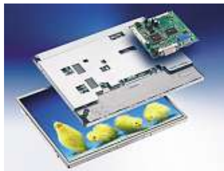
In den easyPanels sind Controlboard, Inverter und bei Bedarf auch Touch integriert

Als Fazit kann man sagen, dass dem LED-Backlight sicherlich die Zukunft gehört und laut Aussagen von verschiedenen Herstellern eine komplette Umstellung von CCFL auf LED bis im Jahr 2015 erfolgen soll. Momentan hat aber sicherlich die CCFL-Röhre bei vielen Anwendungen noch Vorteile.