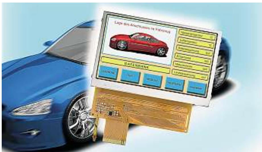
Das Wide-Format hat sich bei den TFTs bereits mehrheitlich durchgesetzt

Wer sich heute einen neuen Fernseher kauft, wird sich sicherlich für einen Flachbildschirm entscheiden. Unser Geld dafür heben wir ganz selbstverständlich von einem Bankterminal mit integriertem TFT-(Thin-Film-Transistor-)Display ab. Im Industriebereich werden Flachbildschirme seit zirka zwanzig Jahren als Mensch-Maschinen-Interface, MMI, verwendet. Damals waren aber nur passive LCDs im alphanumerischen Bereich oder Grafikdisplays mit geringer Auflösung verfügbar. Inzwischen ist aber auch in diesem Bereich die hochauflösende TFT-Anzeige Standard. Aufgrund der immer besseren Performance, welche inzwischen auch rauen Industrieumgebungen gerecht wird, und des seit Jahren kontinuierlich fallenden Preisniveaus hat sich ein Segment mit speziellen Displays für den Industrieinsatz entwickelt.