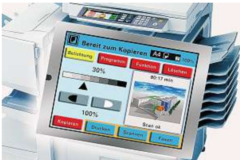
Die 7,5"-Diagonale hat sich in den letzten Monaten immer mehr als Standard im Industriebereich etabliert