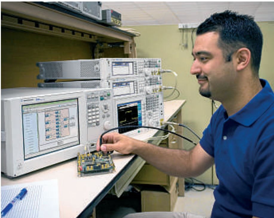
Eine deutliche Reduktion der Entwicklungszeit und damit eine schnellere Time-to-Market ist eine Stärke des N5106A

Der PXB-MIMO-Empfängertester erlaubt in einer früheren Phase des Entwicklungszyklus schnelle und genaue Messungen an MIMO-(Multiple-Input-Multiple-Output-)Empfängern. Der neue PXB ist ein sehr leistungsfähiges Tool für die Simulation realistischer Einsatzbedingungen. Er minimiert das Design-Risiko und verkürzt die Entwicklungszeit signifikant.