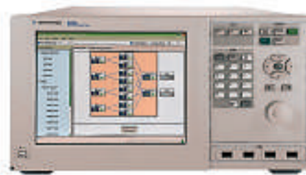
Das Gerät unterstützt 2x2-, 2x4- und 4x2-MIMO

dem Benutzer ermöglichen, komplexe Basisbandgenerator-Einstellungen und Fading-Tests schnell und einfach zu definieren. Über die intuitive grafische Benutzerschnittstelle mit Drop-Down-Menüs (bzw. für den Zugriff auf MIMO-Kanalmodelle oder eine editierbare Pfadkonfigurationstabelle) lässt sich das Gerät schnell und einfach für den jeweiligen Test konfigurieren, ohne dass der Benutzer sich lange einarbeiten muss.