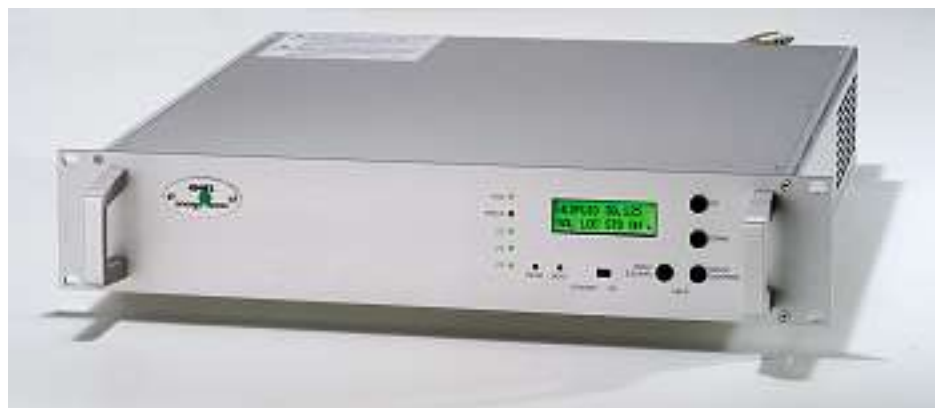
Bild 1: Digital programmierbare Stromversorgungen der 3-kW-Klasse: Alle Einstellungen sind menügeführt direkt am Gerät möglich, aber auch über RS 232- oder CANopen-Schnittstelle

Die Primärschaltregler der 3-kW-Klasse können dank integrierter Mikroprozessoren